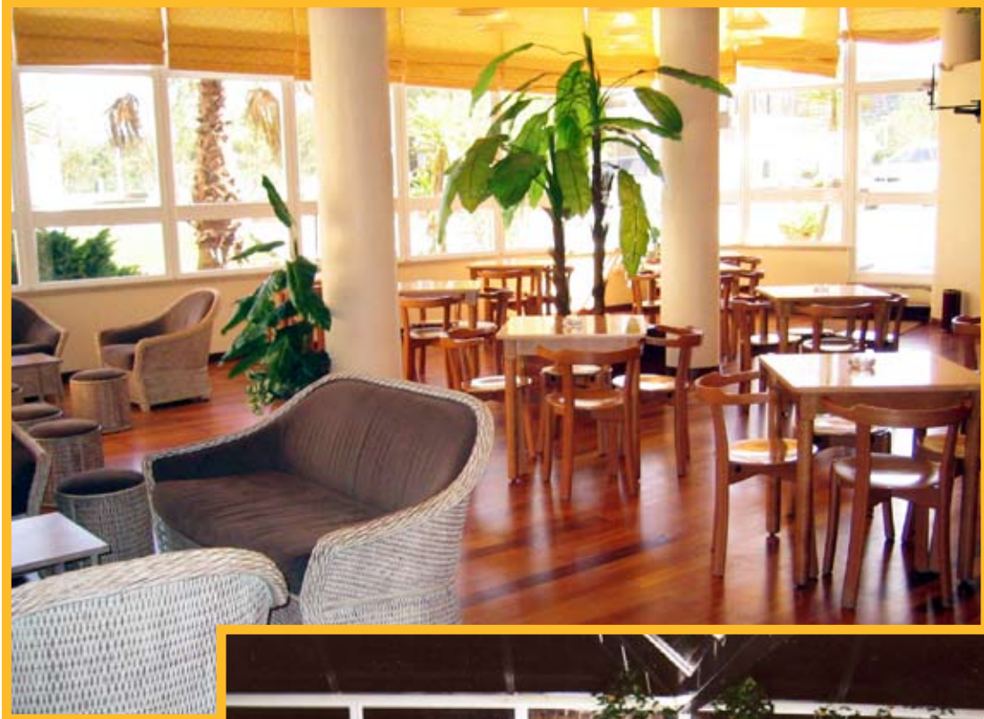
Bar Rosa Náutica