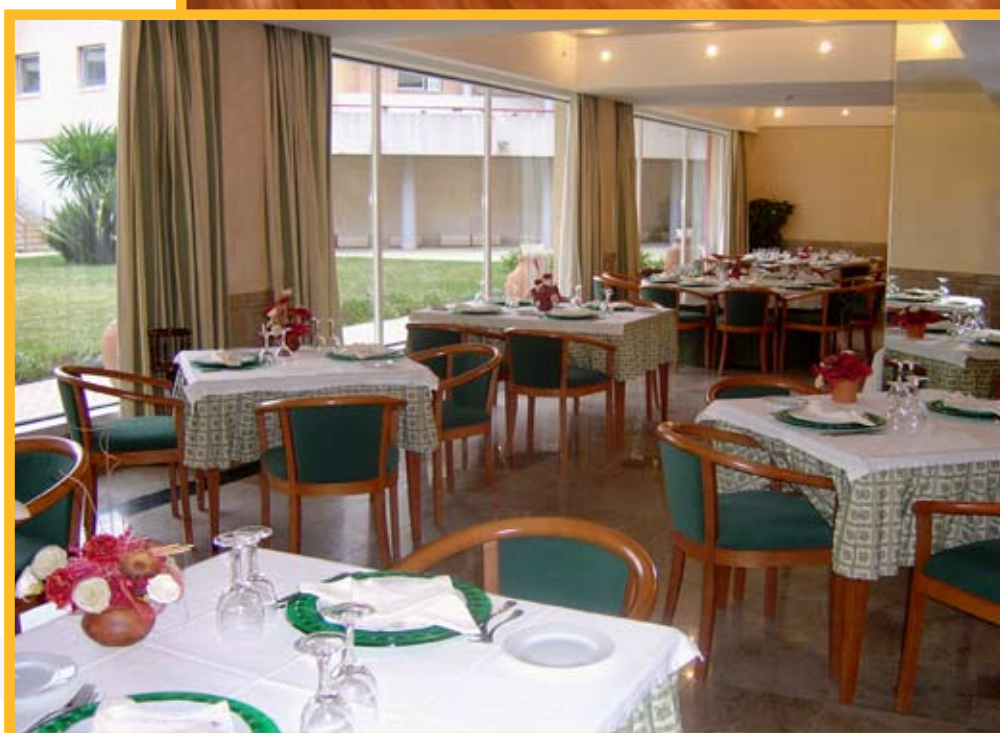
Restaurante Rosa Náutica