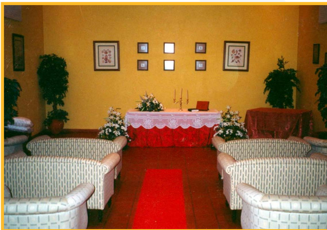
Restaurante Rosa Náutica